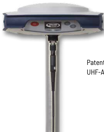
Patentierte Anbringung der UHF-Antenne im Stab